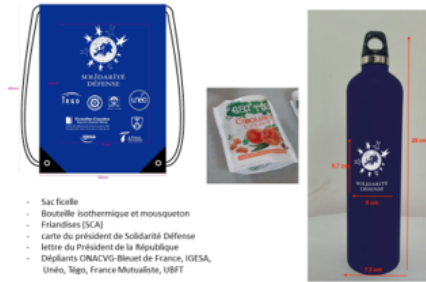
COMPOSITION COLIS DE NOEL 2021